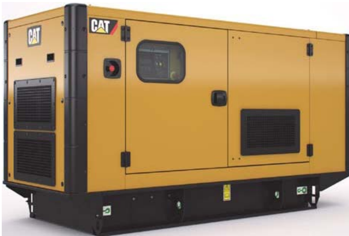
Imagen con finalidad ilustrativa únicamente