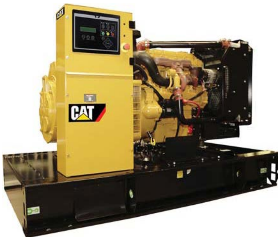
Imagen con finalidad ilustrativa únicamente